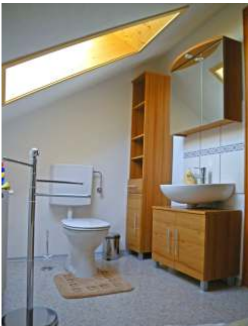
Bad im Dachgeschoss Wanne, WC