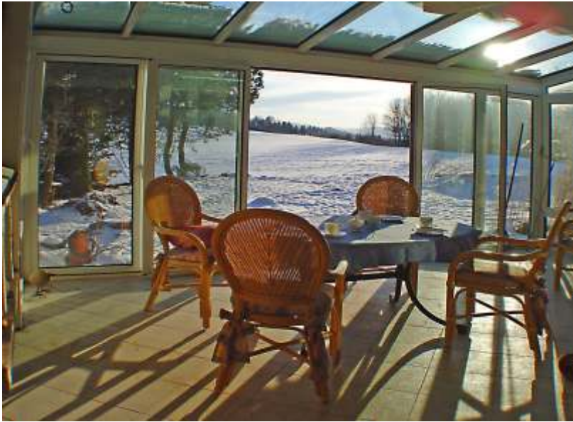
großer Wintergarten mit Kaminofen und Durchgang zum Garten