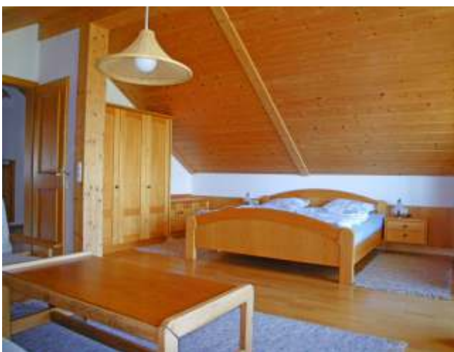
Schlafen 2, Dachgeschoss