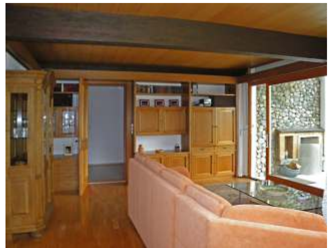
Wohnzimmer mit Durchgang zum Wintergarten