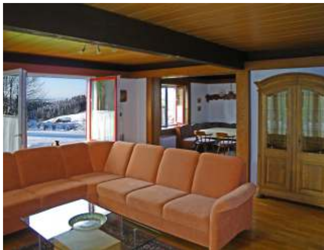
Wohnzimmer, Esszimmer im Hintergrund