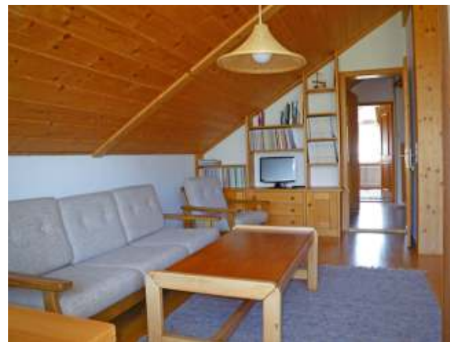
Schlafen 2, Dachgeschoss, Wohnbereich