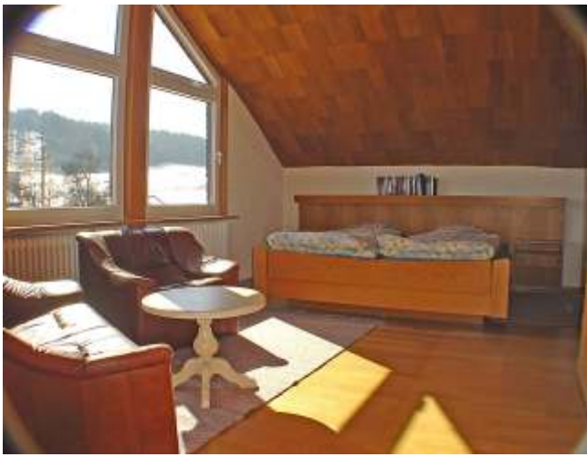
Schlafen 3, Dachgeschoss