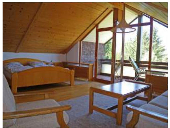
mit überdachtetem Balkon