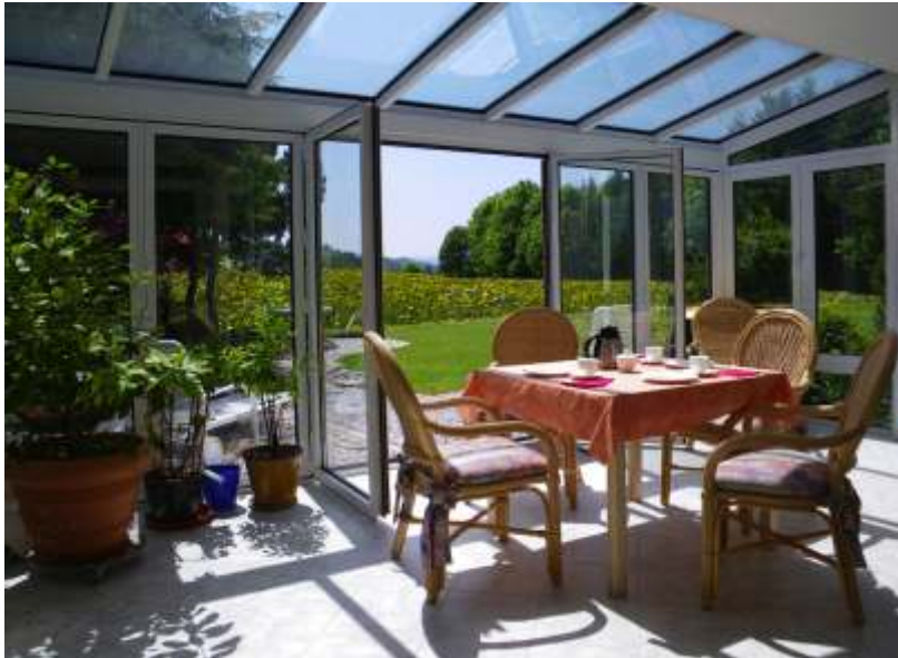
großer Wintergarten mit offenem Kamin und Durchgang zum Garten