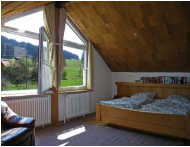
Schlafen 3, Dachgeschoss