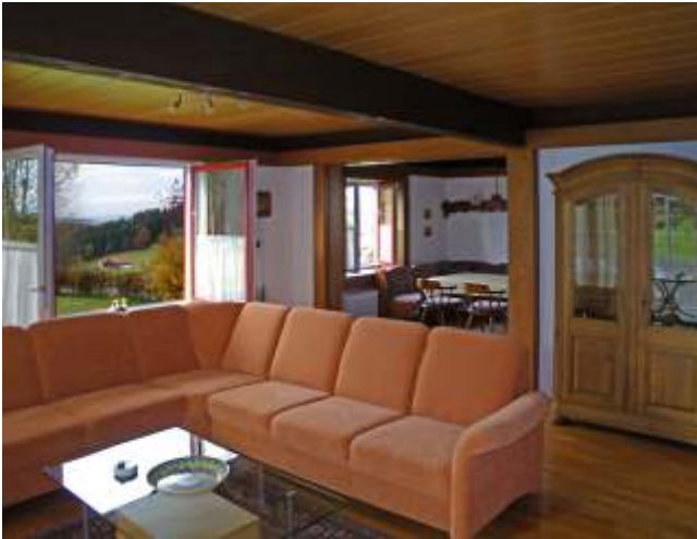
Wohnzimmer, Esszimmer im Hintergrund